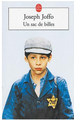
Un sac de billes, de Joseph JOFFO