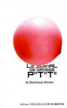
Le Journal de Grosse Patate, de Dominique RICHARD